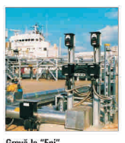
Grevă la "Eni"

Despre anumite companii PROHIBIT ÎI ESTE ZIARULUI "BURSA" SA PUBLICE INFORMAȚII