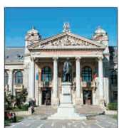
Reabilitarea Teatrului Național din Iași costă șase milioane de euro