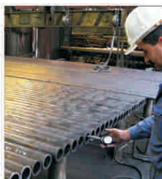
TMK Reșița își reduce producția, iar angajații vor intra în concediu