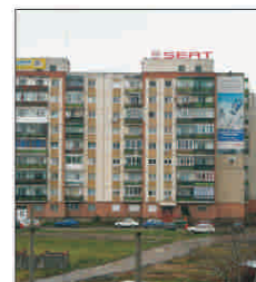
Criza s-a instalat pe piața imobiliară arădeană