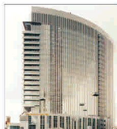
Sprîjin guvernamental de peste 8 miliarde de euro pentru "Commerzbank"