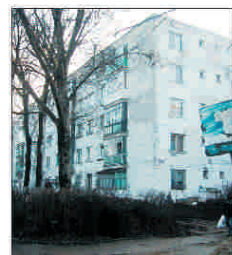
Piata materialelor izolante se dezvoltă, în ciuda crizei