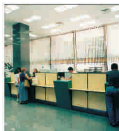
RBS continua sa-si deprecieze activele