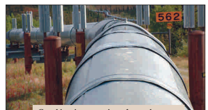
Gazul iranian poate intra în conducta "Nabucco" dacă vrea Obama.

Concretizarea proiectului gazoductului "Nabucco" depinde foarte mult de gazul iranian, a declarat, ieri, la București, cu ocazia unei conferințe Forum Invest, Gerhard Schroeder, fostul cancelar al Germaniei. Ori, în prezent, Iranul este o zonă instabilă, fără posibilități imediate de a se transforma în furnizor sigur de gaze pentru Europa. Domnul Schroeder, în prezent președinte al comitetului acționarilor companiei "Nord Stream", gazoduct susținut de Gazprom, a explicat: "SUA, care susțin Nabucco, nu doresc ca Iranul să se finanțeze, pentru programul nuclear, din exportul de țiței și gaze. Acesta este și motivul pentru care cotațiile petrolului se vor menține la cote scăzute în perioada următoare. Dar SUA vor intra sub administrația lui Obama, care dorește să rezolve problema Iranului prin dialog, și nu intervenție armată. Aceasta este senza Europa de a căștiga Iranul ca furnizor pentru Nabucco, dar nu se știe în cât timp va deveni stabilă zona. Kazahstanul