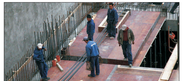
Criza financiară este principala cauză a concedierilor.