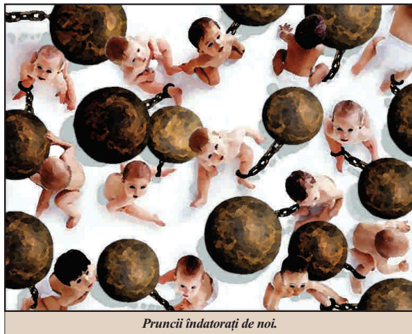
Pruncii îndatorați de noi.

• Datoria ne crește cu 1,5 miliarde de euro pe lună