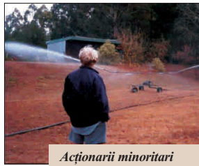
Acționarii minoritari sunt în "time-out" pe termen nedeterminat.

Între acționarii principali ai "Comvev" Constanța, "Soldimet SRL" și "Expert Placement Services Limited", companie controlată de "Mittal Steel Holdings" AG, se dă o luptă pentru supremăție în care faulturile la limita regulamentului, sau chiar în afara acestuia, rămân ne sancționate de către arbitrul pieței de capital (Comisia Națională a Valorilor Mobiliare). Victimele colaterale sunt ceilalți acționari ai "Comvev", care își văd banii blocați într-o majorare de capital inițiată de "Comvev" și o ofertă de preluare lansată de "Mittal" ceva mai mult timp decât se așteptau și, mai mult, nu știu cum va fi soluționat conflictul. Potrivit unor surse din piață, "Mittal Steel Holdings AG" ar avea interes să preia societatea constanțeană pentru a de-