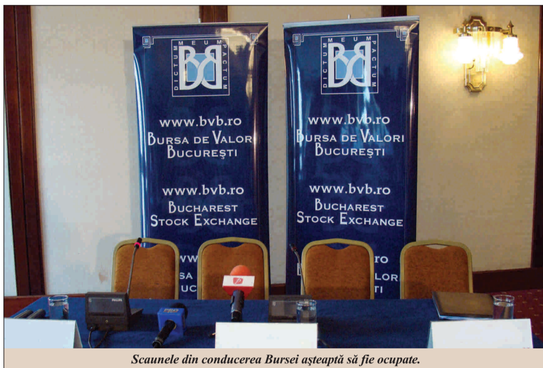
Scaunele din conducerea Bursii așteaptă să fie ocupate.

Jocurile încă nu sunt făcute pentru alegerile programate să aibă loc mâine, când Bursa de Valori București (BVB) urmează să-și înnoiască Consiliul de Administrație și să încredințeze un nou mandat de președinte, pe o perioadă de doi ani.