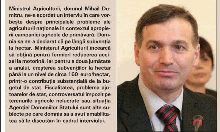
Ministrul Agriculturii, domnul Mihail Dumitru, ne-a acordat un interviu în care vorbim despre principalele probleme ale agriculturii naționale în contextul apropierii campaniei agricole de primăvară. Domnia sa ne-a declarat că pe lângă subvenția la hectar, Ministerul Agriculturii încearcă să obțină pentru fermieri reducerea accizei la motorină, iar pentru a doua jumătate a anului, creșterea subvențiilor la hectar până la un nivel de circa 160 euro/hectar, printr-o contribuție substanțială de la bugetul de stat. Fiscalitatea, problema ajutoarelor de stat, controversatul impozit pe terenurile agricole nelucrate sau situația Agenției Domeniilor Statului sunt alte subiecte pe care domnia sa a avut amabilitatea să le discutăm în cadrul interviului.

Interviu cu domnul Mihail Dumitru, ministrul Agriculturii și Dezvoltării Rurale