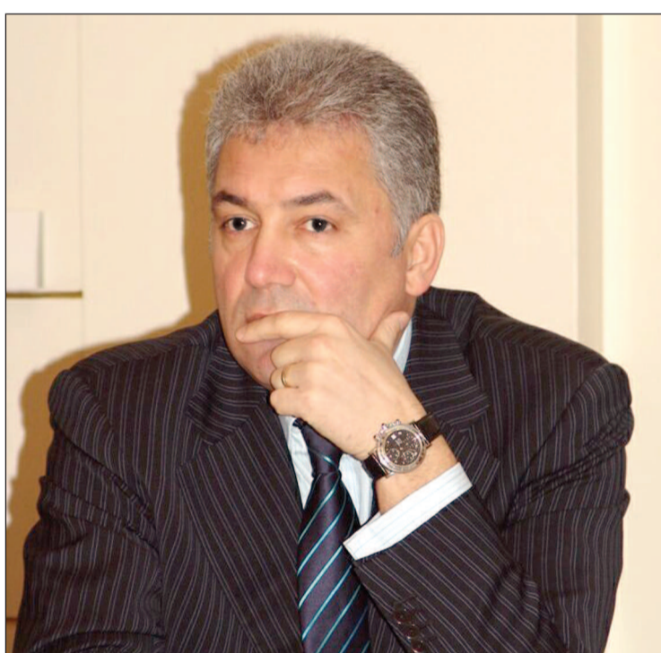
De ce a cerut ministrul Videanu opinia Comisiei Europene abia în 19 aprilie?

Situația de conflict de interese era mai mult decât evidentă în condițiile în care autoritatea care coordonează exact fondurile europene POS-CEE, pe care Marmosim voia să le atragă,