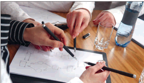
120 de ani ar fi fost necesari pentru implementarea celor 63 de modificări ale Codului Fiscal, conform principiului stabilității fiscale, susțin juriiștii.