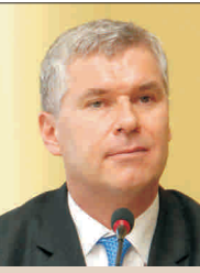
Robert Rekkers, directorul general al Băncii Transilvania: „Vom continua să ieșim împrumuturile, să refinanțăm creditele, însă avem în vedere doar clienții care sunt eligibili”.

"Banca Transilvania are deja un volum al creditelor în creștere cu 8% față de sfârșitul anului precedent.