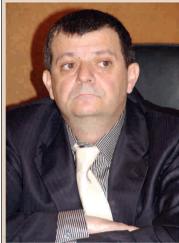
„Cei care cred că BVB este o mină de aur și că Sibiuul nu valorează nimic ar trebui să se uite la volumele zilnice (n.r. - mai sus, graficul evoluției volumelor cu contractul DEDJIA_ROM, scadența septembrie, la Sibiu) făcute de cele două burse în perioada de criză; așa vor înțelege că la Sibiu se poate câștiga și când piața crește dar și când scade”.