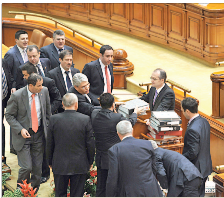
Emil Boc a fost asaltat de dosare cu semnături pentru demiterea sa.

faptei cu o moțiune subțire de tot în soluții, dar grăbindu-se să vândă iar iluzii", a declarat premierul Emil Boc, în fața parlamentarilor, adăugând că opoziția propune "soluții