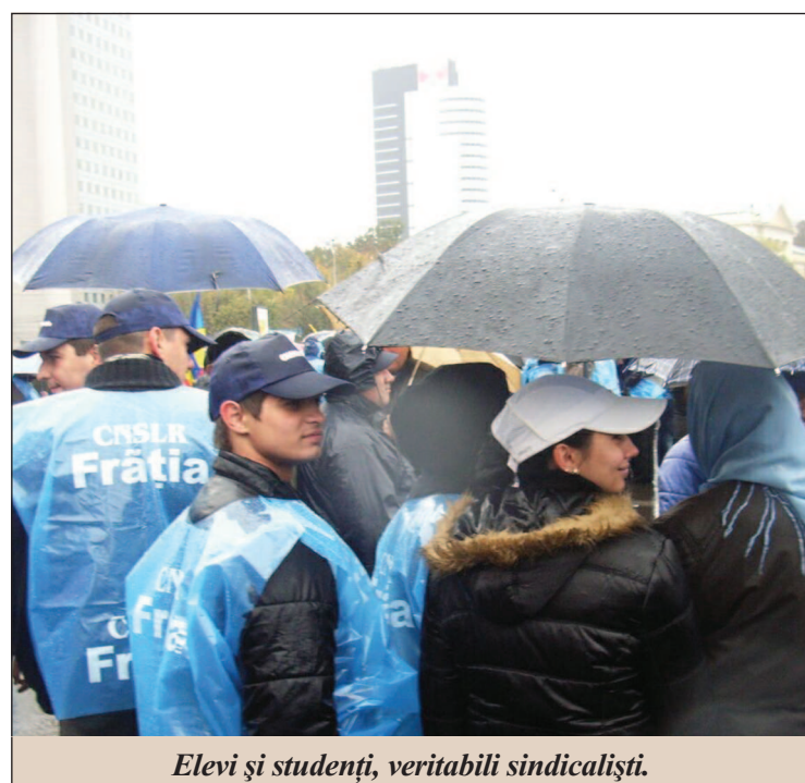
Elevi și studenți, veritabili sindicaliști.

La mitingul organizat de sindicate au participat și persoane care urmau să fie plătite ca să protesteze. De acest lucru am aflat marți și am de-