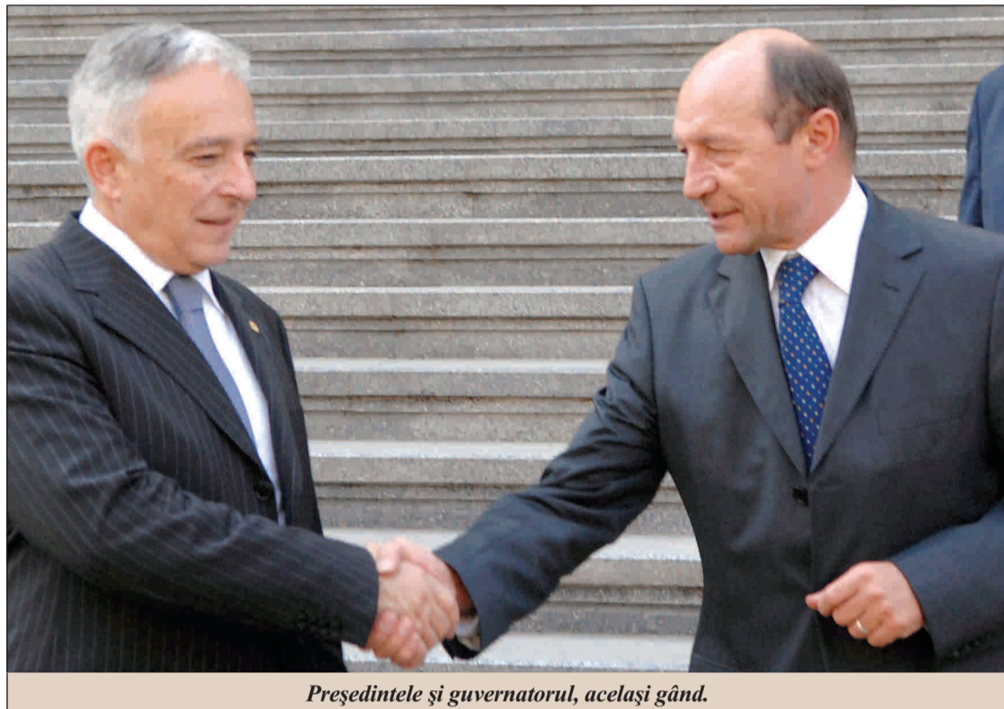
Președintele și guvernatorul, același gând.

T ara noastră va dispune de o linie de credit de câteva miliarde de euro de la UE și FMI pe care o va utiliza în situația în care economia reintră în derapaj. Aceasta este principala prevedere a noului acord de tip preventiv pe care oficialii noștri urmează să îl semneze, în perioada următoare, cu finanțatorii internaționali.