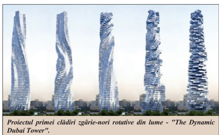
Proiectul primei clădiri zgârie-nori rotative din lume - "The Dynamic Dubai Tower".

Bucureștii ar putea să aibă o clădire turn de 60 de etaje, care își va gestiona singură energia, după modelul celebrului zgârie-nori rotativ proiectat în Dubai.