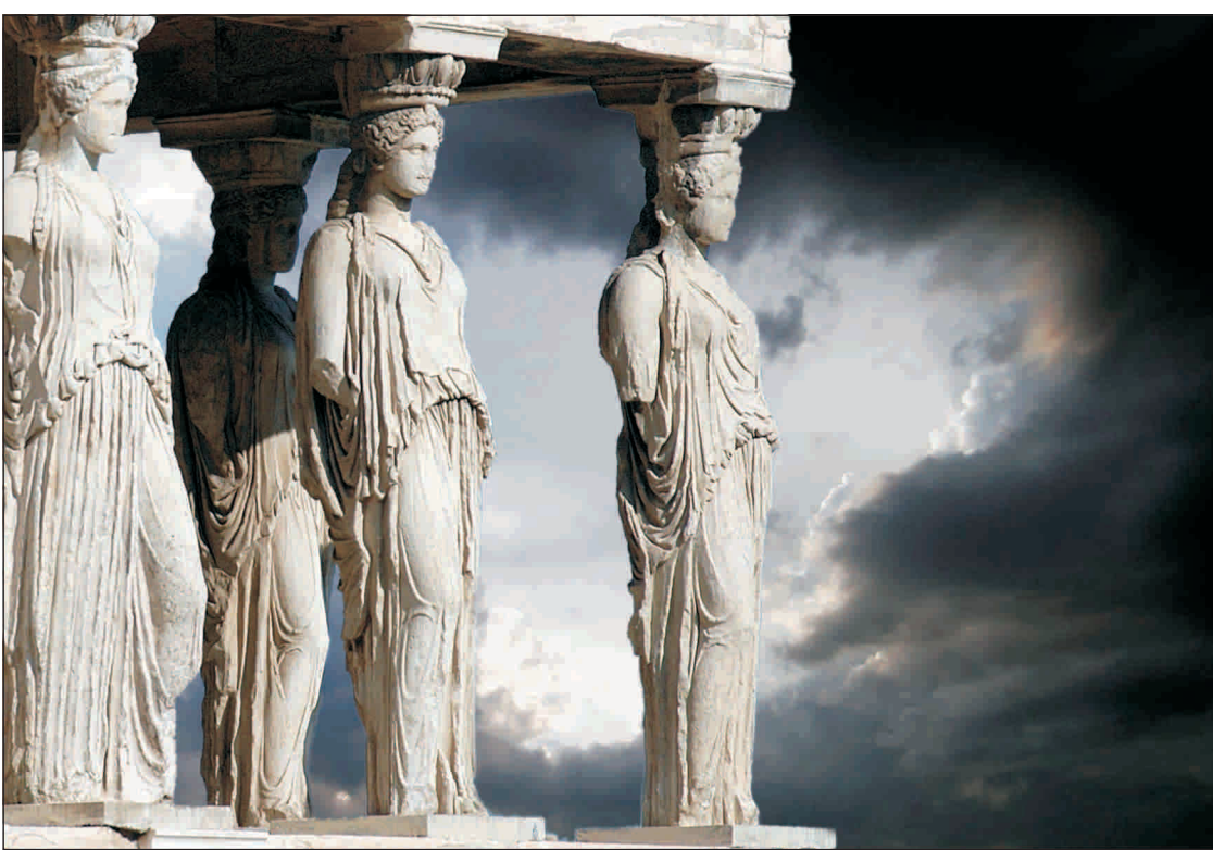
Peste Acropole, încă nu iese soarele.

Legislativul grec a început, ieri, să dezbate planul privind noile reduceri de cheltuieli bugetare și privatizarea activelor statului, iar astăzi ar urma să fie acordat votul de încredere noului Cabinet, după remanierea efectuată vineri.