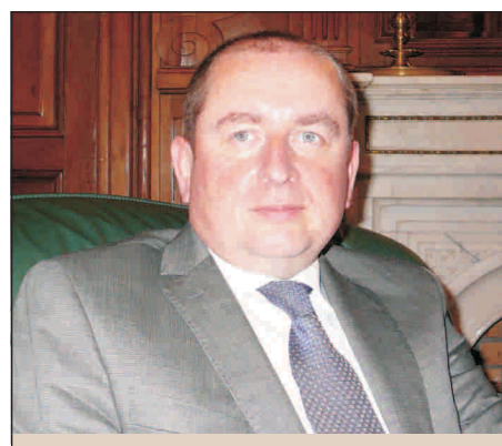
Exelența sa, domnul Marek Szczygiel, ambasadorul Republicii Polonia la București: "Trebuie să întărim solidaritatea europeană".

Noi ne propunem un program îndrăzneț, dar suntem conștienți că pe parcurs pot apărea și elemente nepre-