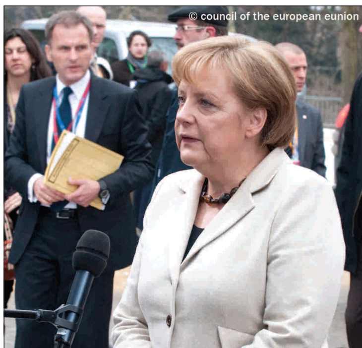
Angela Merkel: "Pentru România este absolut necesar să aibă o asigurare cu băncile, cu sistemul bancar".

Cele mai mari bănci austriece prezente în Europa de Est sunt "Erste Group Bank" și "Raiffeisen Bank