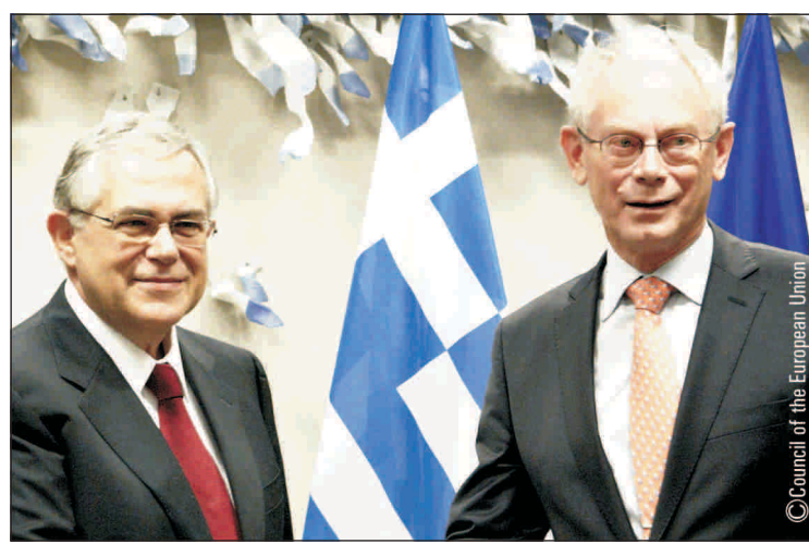
Noul premier al Greciei Lucas Papademos (stânga) a discutat ieri cu președintele Consiliului European Herman Van Rompuy, la Bruxelles, despre noul pachet de finanțare pentru Grecia.

Concluzia se impune, în condițiile în care 60% dintre cei chestionați sunt de acord că Papademos, fost vicepreședinte al Băncii Centrale Europene, este cea mai bună șansă a Greciei să rămână în Zona Euro și deci coborârea în preferințele electoratului poate fi explicată doar prin creșterea proporției de greci care ar vrea să se întoarcă la drahmă.