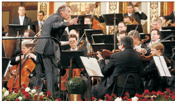
Anul Nou începe printr-un concert al băncilor din estul Europei, la Viena.

Un viceguvernator din cadrul Băncii Naționale a României (BNR), alături de alți oficiali bancari din 16 țări europene, a participat, ieri, la o conferință la Viena, ca să discute despre problema capitalizării băncilor din zona euro și despre posibilul impact negativ asupra țărilor emergente, potrivit lui Adrian Vasilescu, consilierul guvernatorului BNR. Domnia sa nu a oferit și alte detalii, menționând că oficialii de la Viena au avut ca informații despre conferință să rămână confidențiale. Potrivit unor surse citate de Bloomberg, tema discuțiilor de la Viena urma să fie legată de propunerile