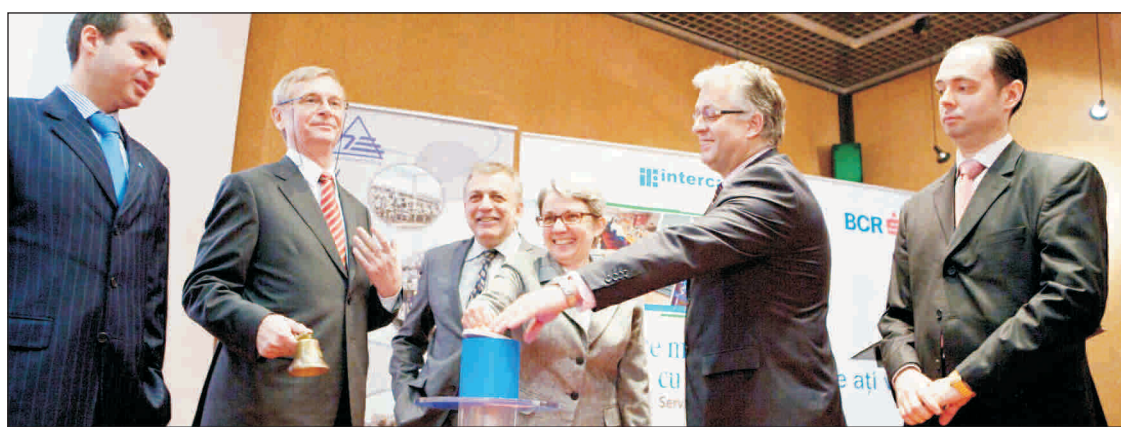
Oficialii "Transelectrica", BVB și ai consorțiului de intermediere, la startul ofertei secundare de vânzare pentru 15% din "Transelectrica".

Oferta publică "Transelectrica" (simbol TEL) a fost acoperită în proporție de 134,18% de către investitori, cei mai interesați fiind însă cei din segmentul retail care au subscris 2,844 milioane de acțiuni TEL (258,71% din tranșa alocată lor) la prețuri cuprinse între 14,90 și 19,20 lei/unitate.