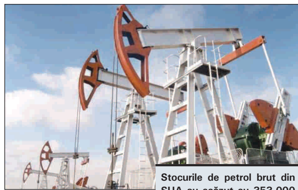
Stocurile de petrol brut din SUA au scăzut cu 353.000 de barili, la 385,9 milioane de barili săptămâna trecută, conform American Petroleum Institute.

în iulie a scăzut cu 0,9%, la 102,50 dolari/baril. Luna aceasta, cotația a pierdut circa 14% la bursa londoneză - cel mai important declin din mai 2010 până în prezent.