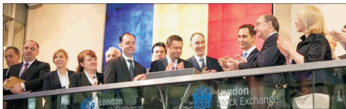
Ministrul Lucian Isar a deschis, pe 17 mai, ședința de tranzacționare la Bursa din Londra, dar a ratat ocazia să o deschidă și pe cea a Burselor de Valori București...

Cererea de intrare în insolvență a "Hidroelectrica" dăunează grav investitorilor, în plin program de privatizare prin bursă a companiilor de stat.