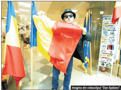
Imagine din videoclipul "Dan Spătaru".

Adrian Năstase a condus doctoratul lui Victor Ponta. Adrian Năstase este condamnat la pușcărie și se sinucide.