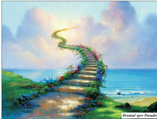
Drumul spre Paradis

3 iulie: - a fost revocat Avocatul Poporului Gheorghe Iancu și înlocuit cu Valer Dorneanu, fost deputat PSD; Scopul: Avocatul Poporului are