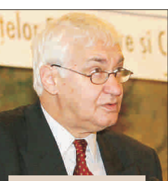
Petre Pavel Szel ne-a spus că AGA a fost convocată întrucât expira mandatul actualului Consiliu.

Chiar și așa, convocarea pare oportună pentru SAI Muntenia, întrucât aceasta ar putea amâna să dea curs solicitării CRA. O conducere proaspătă