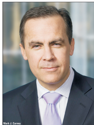
Mark J. Carney

Mark J. Carney a fost numit guvernator al Băncii Canadei în 2007 și a început mandatul de șapte ani la 1 februarie 2008, conform datelor de pe site-ul băncii centrale canadiene.