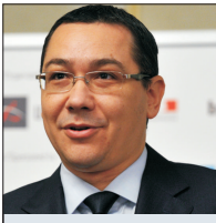
Premierul Victor Ponta se bucură de Statistică.

ALEXANDRU SÂRBU (continuare în pagina 3)