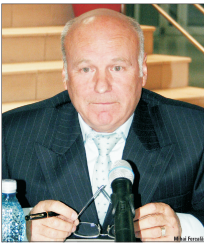
SIF Transilvania a adus trei societăți la cota SIBEX în acest an.

Vara trecută, acționarii „Aro Palace” din Brașov își dăduseră acordul pentru listarea acesteia pe piața