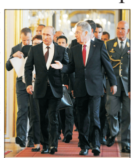
Vladimir Putin s-a întâlnit săptămâna trecută cu președintele austriac Heinz Fischer.

După ce șefii Gazprom și OMV au semnat, săptămâna trecută, la Viena, controversatul acord pentru construirea gazoductului South Stream, această acțiune fiind considerată o sfidare a Austriei la adresa Uniunii Europene, a apărut “eternul” zvon potrivit căruia Gazprom vrea să