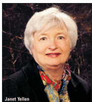
Janet Yellen a șomajului din ultimul an a fost interpretat ca un indicator de netăgăduire al succesului relaxării cantitative din Statele Unite. Dar chiar așa și fie?

John Crudele, de la New York Post, se luptă de multe luni cu autoritățile de la Washington pentru a obține documentele care să susțină teza manipulării datelor statistice privind ocuparea forței de muncă (n.a. vezi și articolul "Guvernul american manipulează datele statistice pentru a susține iluzia redresării economice", BURSA, 20.11.2013). În ciuda cererilor oficiale adresate Departamentului Comerțului, în conformitate cu prevederile legii liberului acces la informațiile de interes public, Crudele nu a primit decât o parte din corespondența electronică solicitată, iar o mare parte a acesteia a fost cenzurată.