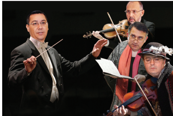
Naționaliștii unguri și naționaliștii români cântă împreună "Sârba în căruță", sub bagheta lui Victor Ponta.

Călin Popescu Țăriceanu, Corneliu Vadim Tudor și Teodor Meleșcanu și-au exprimat, ieri, spri-