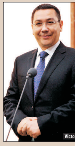
Victor Ponta de ce!" Parcă ar fi fost un vers din "Pe lângă plopii fără soț". "O lume toată-ntelega/Tu nu m-ai înțeles".

Victor Ponta a declarat că ar putea demisiona din funcția de premier al României, în două variante: 1. dacă noul președinte Klaus Iohannis ar garantea că va numi un succesor PSD-ist; 2. dacă DNA ar cere urmărirea sa penală în dosarul privind votul din diaspora (dar a arătat că trebuie să se renunțe la "fidejusele din 2004" și o persoană care a pierdut alegerile trebuie să intre în închisoare). Opțiunea să rămână premier pare să fie cea mai prezată alegere, punându-l în situații ridicole, cum o arată și "perla" cu închisoarea. La sfârșitul săptămânii trecute, a explicat, încă o dată, că nu s-a crezut că diaspora se va prezenta la urne în exces față de alegerile trecute și că asigurând acestor capacitate a secțiilor de votare și considerat îndeplinit datoria. Ceea ce este o adevărată "perla", pentru că nici la alegerile din anul trecut capacitatea secțiilor de votare nu a fost suficientă, chinându-i românii din diaspora. Tot o "perla" a servit și clujeanul serios Ioan Rus, care, întrebat de raportorul unei televiziuni dacă este de părere că Victor Ponta ar trebui schimbat din funcția de președinte PSD, a răspuns: "Nu vîd