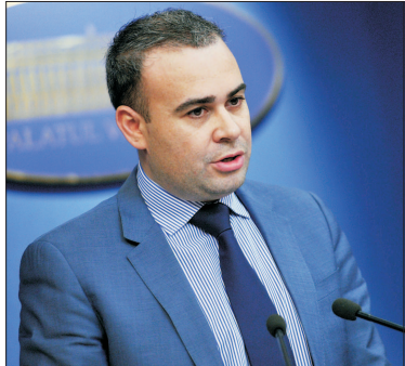
Darius Vălcov: "Nu am mandată să discutăm despre un deficit sub 1,4%".

● Vălcov: "FMI a cerut deficit de 0,9%, ceea ce este inacceptabil" ● Există zvonuri potrivit cărora discuțiile cu reprezentanții delegației FMI ar putea fi întrerupte, iar acordul dintre noi și forurile internaționale ar putea înceta ● Cabat: "Ruperea acordului cu FMI înseamnă că nu va mai fi nimeni care să ne controleze derapajele economice" ● Ponta: "Solicitarea FMI nu este posibilă, nu cred că acordul va fi rupt"