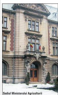
Sediul Ministerului Agriculturii