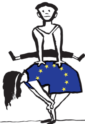
Capră pentru greci.

● Noul premier elen vrea restructurarea datoriilor Greciei, în majoritate către Germania și Franța