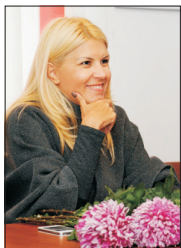
În scandalul actual, Elena Udrea este exponentul unei dintre tabere.

Se mai spune că, la începutul anului 2004, Victor Ponta ar fi primit un mesaj: nu candida, căci, dacă vei candida, vei pierde alegerile, iar dacă le vei pierde, vei fi marginalizat din punct de vedere politic și vei avea probleme cu justiția. Având în vedere experiența anterioară și mentor al său, Victor Ponta a dat