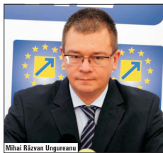
Mihai Răzvan Ungureanu

Practic, UNPR a schimbat ieri majoritatea parlamentară, alăturându-se opoziției, pentru „interesul național”, după cum a declarat președintele interimar Gabriel Oprea, care a anunțat că va rămâne totuși la putere: „Românii au nevoie în această perioadă de securitate, stabilitate și seriozitate, UNPR este un partid serios care își respectă cuvîntul dat. Sunt aici colegii mei, mergem, votăm propunerea președintelui României, este președintele ales pe probleme de securitate națională, în rest, suntem membri ai unei coaliții de guvernare și este de bun simț să respectăm