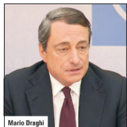
credibil din partea autorităților de la Atena, BCE nu a mai majorat asistența de urgență acordată băncilor din Grecia, prin programul EAF, care este de aproape 89 de miliarde de

Remarcile lui Draghi söt în evidență impasul cu care se confruntă liderii din zona euro, care așteaptă propunerile de reformă ale guvernului condus de premierul elen Alexis Tsipras înaintea de termenul limită, a expirat la miezul nopții trecute. În lipsa unui program de reforme