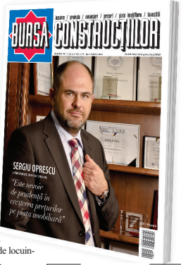
Călin, în pagina 2, nouștii și tendințele pe piața construcțiilor, despre care puteți afla în al șaselea număr din 2015 al revistei BURSA CONSTRUCȚILOR.