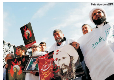
Iranienii protestează contra Arabiei Saudite, în Teheran.