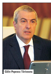
Călin Popescu Tăriceanu