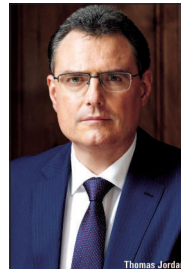
Thomas Jordan. Mesajul pare să aibă alt stil decât de obicei, pare o altă școală de gândire, este un mesaj mult mai clar decât al altor bancheri centrali, spun consultanții economici.

Mesajul președintelui SNB trebuie să aibă conotații și atrage atenția, având în vedere că vine de la un bancher central, spun analiștii economici, subliniind că niciun guvernator nu ar face astfel de afirmații fără ca ele să aibă substrat.