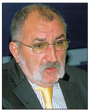
Acționarii minoritari susțin că Ion Țiriac a primit dublu decât li s-a oferit lor.