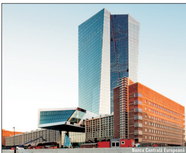
Banca Centrală Europeană