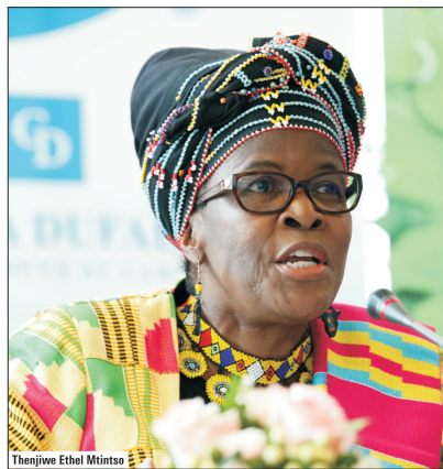
Thenjiwe Ethel Mtintso

● "Uneori, mi-aș dori ca ceea ce se întâmplă în România privind lupta anticorupție să aibă loc și în Africa de Sud"