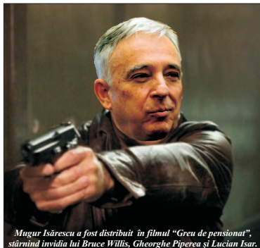
Mugur Isărescu a fost distribuit în filmul "Greu de pensionat", stăruind învidia lui Bruce Willis, Gheorghe Piperea și Lucian Isar.

În privința contractului de muncă de care zice domnul Dan Suciu, nu există un contract de muncă pentru un demnitar. Este vorba despre o funcție publică, un oponent al Guvernatorului BNR, în care acesta spune că veniturile lui Mugur Isărescu ating 40.000 euro pe lună. "Acesta nu mă refer la veniturile de tip «Măr SRL» ori la «tranzacții anterioare» ori la atenții, ci doar la Pensie plus Salariu plus Bonusuri-le de performanță, plus Participații la ședințe, toate legate de poziția de Guvernator BNR. Acesta este motivul pentru care Guvernatorul BNR