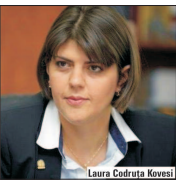
Laura Codruța Kovesi

● Kovesi: "Ne îngrijorează mai mult efectele dramatice pe care le are corupția, nu atacurile persoanelor cercetate"