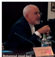
Mohammad Javad Zarif

"Terorismul și extremismul - rezultatele resentimentelor popoarelor afectate de «invaziile și ocupațiile străine»"