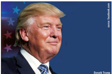
“Trump poate fi mai bun pentru Europa decât Clinton”. Edmund Stoiber, fost premier al Bavariei

P roteste violente ale tinerilor “liberali” furioși și petiții pentru declanșarea procesului de secesion în California și Oregon au fost primele reacții ale “stângii” din marile orașe ale Statelor Unite după victoria lui Donald Trump. “Progresivul” manifestanților nu a mai fost de ajuns pentru a opri ieșirea la suprafață a urii și intoleranței. Dar cine sunt cei care s-au ridicat deja împotriva “îrănușului” Trump? “Același idiot” care au participat la mișcarea Occupy Wall Street au ieșit acum în stradă deoarece candidatul finanțat de Wall Street nu a câștigat”, a remarcat jurnalistul independent Paul Joseph Watson. În mediul academic s-au atins chiar noi culmi ale absurdului, prin reacțiile incredibile ale celor care, cel puțin teoretic, ar trebui să fie conducătorii de mâine. Cotidianul New York Post a inventariat măsurile adoptate la nivelul unor renumite universități pentru “îmblănzirea” studenților și profesorilor. “University of Michigan a oferit studenților săi traumatizați cărți de colorat și plastilină”, scrie NYP, în timp ce University of Kansas a pus la dispoziție căni pentru terapie, iar Cornell University a ținut “sesiuni” de plâns în comun. Un număr mare de profesori au anulat cursurile sau examenele, din proprie inițiativă sau ca urmare a cererilor din partea studenților, pe fondul stresului insuportabil. CĂLIN RECHEA