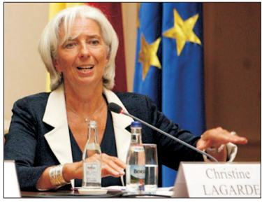
Curtea de Justiție a Republicii Franceze a stabilit, ieri, că actualul director general al Fondului Monetar Internațional (FMI), Christine Lagarde, este vinovată de neglijență în serviciu, într-un dosar de arbitraj