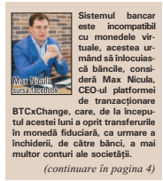
BTCXCHANGE, care, de la începutul acestei luni a oprit transferurile în moneda fiduciară, ca urmare a incidentului, de către bănci, a mai multor conturi ale societății. (continuare în pagina 4)

● "Există o animozitate din partea sistemului bancar față de Bitcoin" ● "În lumea Bitcoin, fiecare persoană își este propria bancă, acesta fiind efectul descentralizării"