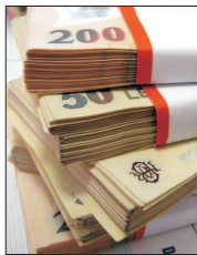
decât dobânda cheie pentru cele ipotecare și imobiliare. Specialistul ne-a precizat: "Dacă"